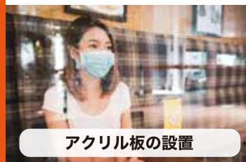
アクリル板の設置