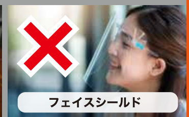
フェイスシールド